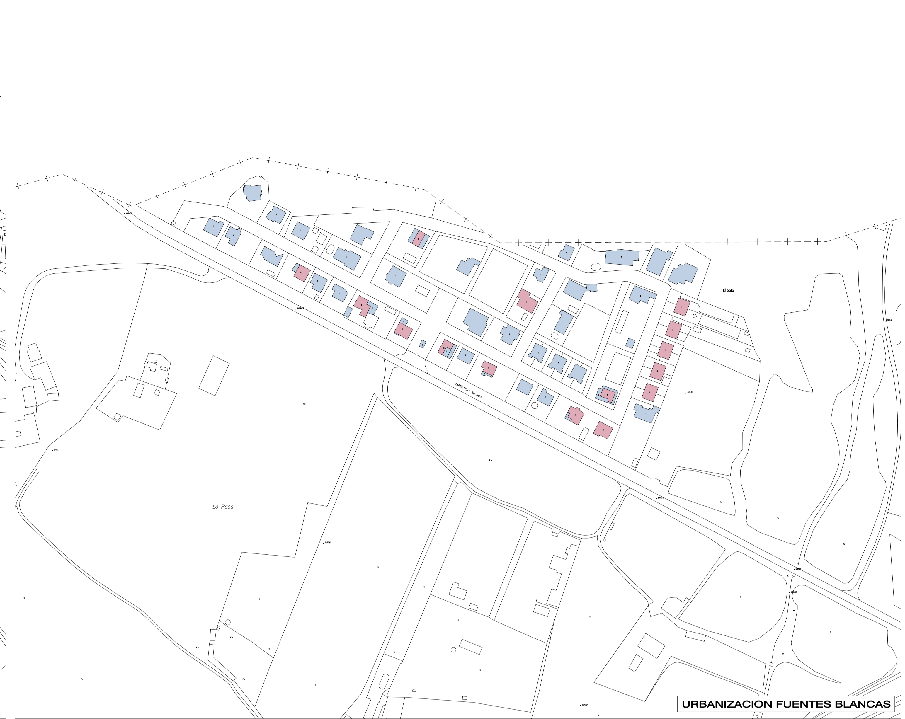
URBANIZACION FUENTES BLANCAS